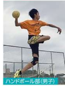
ハンドボール部(男子)