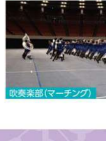
吹奏楽部(マーチング)